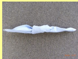
⑦ 片方の耳を広げて 結び顔を作る