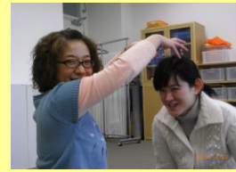
♪あきは、コオロギくさのなか～