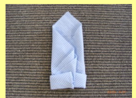
④ 裏に反して 重なるように折る