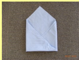
② 真ん中で重なるように折る