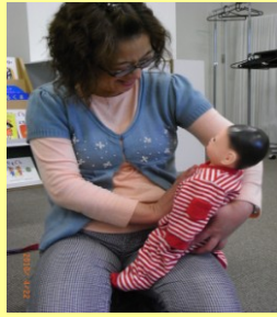
♪おなかのたいこ トントコトン!