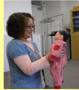
♪〇〇ちゃんのたいこ トントコトントン!