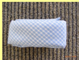
⑥ 矢印の部分が飛び 出さないように両はじを 持って耳が出るまでひっくり返す