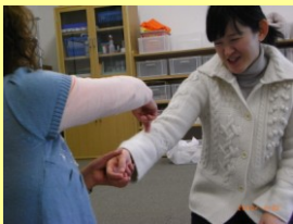
♪はるは、もぐらもおさんぽで～