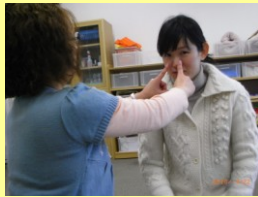
♪なつは、セミさんミンミン!