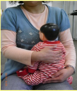
♪せなかのたいこ トントコトン!